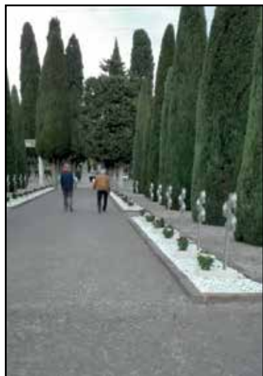
Il viale delle rimembranze.