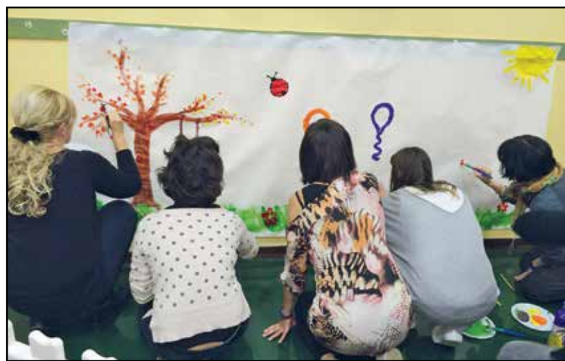
Genitori coinvolti nel progetto.

La narrazione della fiaba avrà inizio da un libro con immagini molto semplici, che poi verranno sviluppate nel corso dell'anno attraverso libri illu-