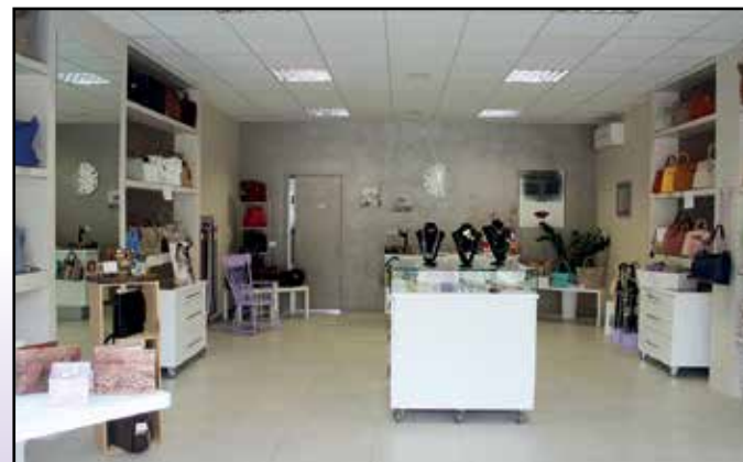
Il negozio di Madame Coco a Montichiari dopo la Farmacia Comunale.

Chiuso il lunedì Via Mons. V.G. Moreni, 83 - Montichiari (BS) - Tel. 030.962205