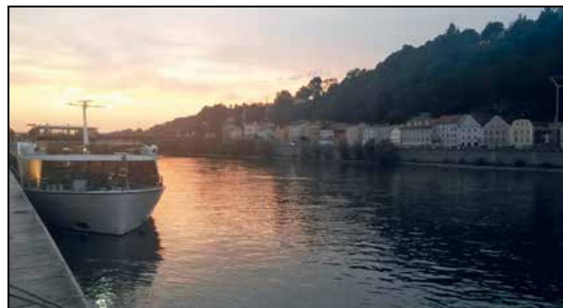
Un tramonto sul Danubio.

Mi mancano i rumori dell'Italia, dei ristoranti, dei bar: qui