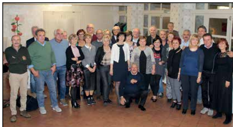
I coetanei della classe 1954.

trascorrere una piacevole serata in un ambiente accogliente, dove non mancano gli spazi, buone portate con musica in sottofondo e balli a fine serata. Alla prossima.