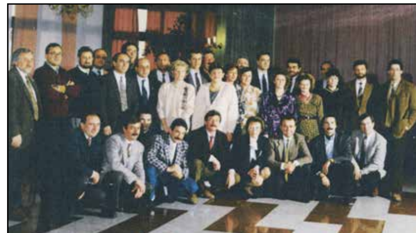
La classe 1950.

Siamo nel 1990 presso un noto ristorante di Montichiari dove i ragazzi del '50, tirati a lucido come il pavimento, posano per la foto ricordo.